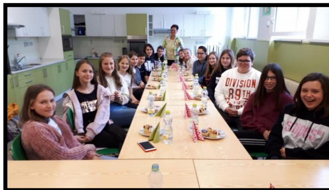
Výměnný pobyt z partnerské školy v Taufkirchenu

V rámci rozšíření výuky německého jazyka pokračuje spolupráce a partnerství se základní školou v rakouském Taufkirchenu. Ve dnech 13. – 15. 5. 2019 se uskutečnil výměnný pobyt do partnerské školy v rakouském Taufkirchenu. Letošní vzájemné výměny do rodin se zúčastnilo 16 žáků z obou škol.