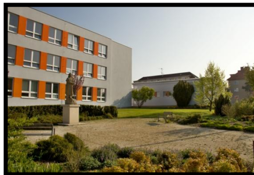
Budova I. stupně a tělocvičny

Učitelé mají k dispozici celkem pět kabinetů a dvě sborovny, které jsou vybaveny počítači s internetovým připojením, tiskárnami i kopírkami. Ve školním roce 2016/2017 byl nově vytvořen kabinet pro asistentky pedagoga na I. stupni. Ve školním roce 2018/2019 byl vytvořen kabinet pro asistentky pedagoga na II. stupni, začalo přebudování skladu materiálu na školní knihovnu celková modernizace učebny fyziky a chemie.