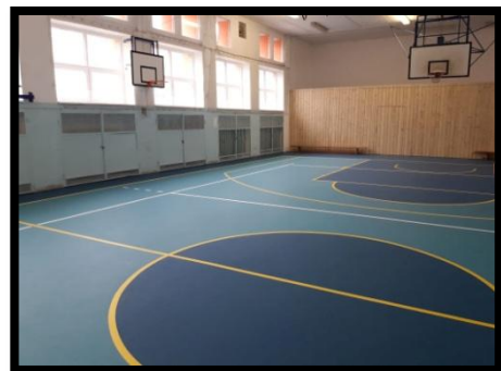
Tělocvična školy po rekonstrukci podlahy a nářadovny

Ve školním roce 2018/2019 byla škole přidělena dotace z programu IROP na projekt „Modernizace učebny fyziky a chemie“ v předpokládané výši 1.881.486,40 Kč. Vlastní realizace modernizace učebny, úprava WC na bezbariérové a zakoupení schodolezu začala na konci června 2019.