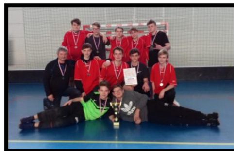
KK házená – Sezimovo Ústí