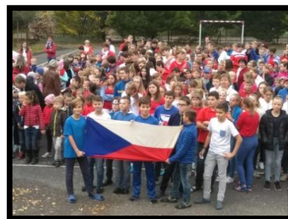
výročí 100 let České Republiky