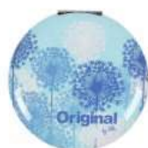
..... a spousta doplňků.