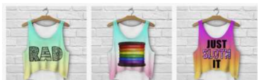
...také se budou nosit crop topy s cool nápisem....