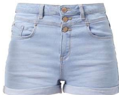
..... a kraťasy s vysokým pasem.....