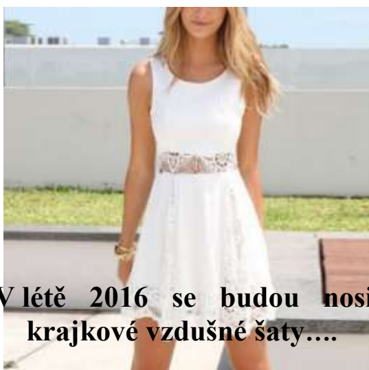
V létě 2016 se budou nosit krajkové vzdušné šaty....